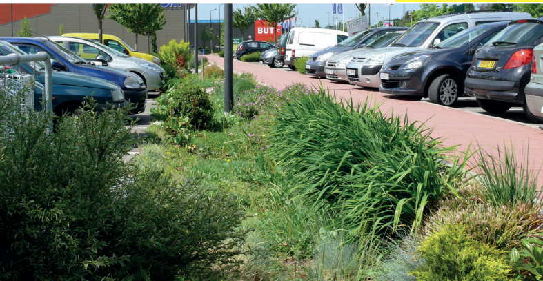
▲ Parking végétalisé