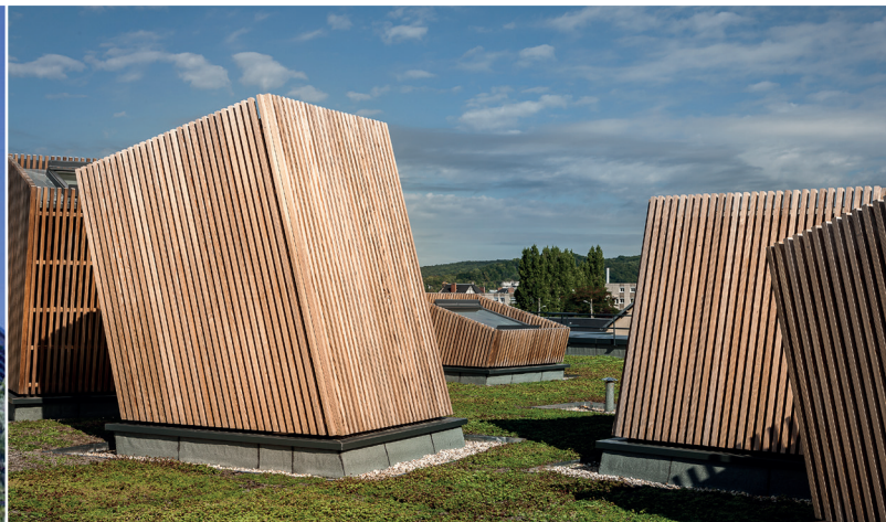
▲ Toiture végétalisée