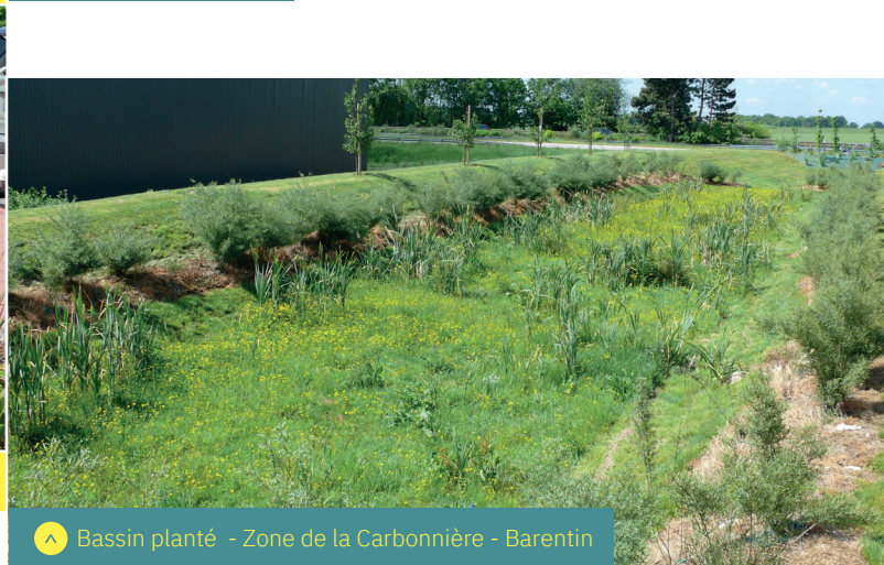
▲ Bassin planté - Zone de la Carbonnière - Barentin