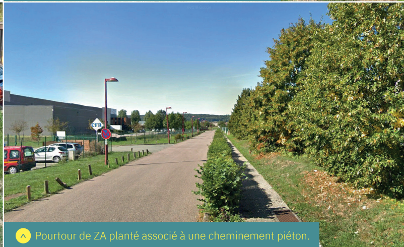
▲ Pourtour de ZA planté associé à un cheminement piéton.

L'ensemble des plantations d'une zone d'activités peut être entretenu par le biais d'une seule entreprise de paysage missionnée par une structure de gestion commune des entreprises. Cela permet de réaliser des économies d'échelles et un gain de temps.