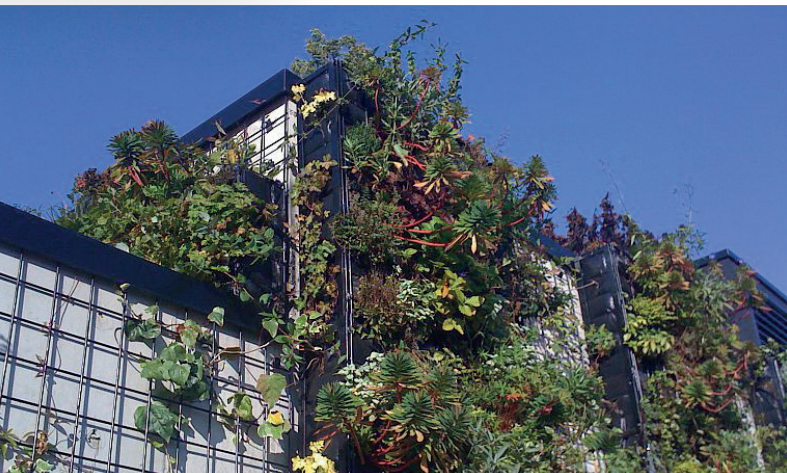
▲ Mur végétalisé